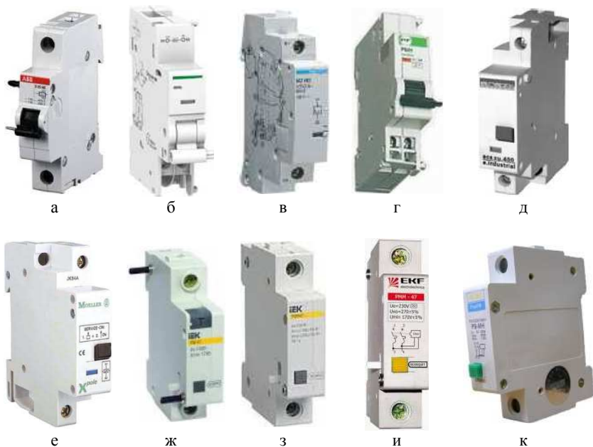
Рис. 1 – Модульные расцепители напряжения:

а – S2C-UA 230 AC, S2C-OVP1, S2C-OVP2 (ABB); б – iMN, iMNs, iMSU (Schneider Electric); в – MZ206 (Hager); г – PMH (PF); д – e.industrial.acs.zu (E-NEXT); е – Z-USA/230, Z-USD/230 (Eaton (Moeller)); ж – PM 47 (IEK); з – PMM 47 (IEK); и – PMM 47 (EKF); к – PB-MH (AcKo-УКРЕМ).