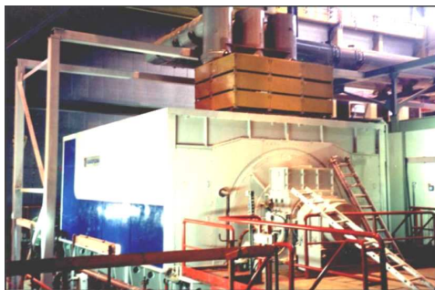
Рис. 1 – Турбогенератор мощностью 160 МВт с воздушным охлаждением для газовой турбины ПГУ – 450.

Турбогенераторы максимальной мощности с полным воздушным охлаждением были созданы на заводах фирм ABB и ALSTOM : в 1995 г. был создан ТГ мощностью 300 МВА, в 1999 г. – мощностью 500 МВА. С учетом конъюнктуры рынка, на заводе "Электросила" (ОАО "Силовые машины", г. Санкт-Петербург) была разработана новая серия ТГ с воздушным охлаждением для паровых и газовых турбин номинальной активной мощностью до 350 МВт (рис. 1). К настоящему моменту изготовлены и успешно эксплуатируются на местах установки около сорока ТГ этой серии. ТГ для сопряжения с паровыми турбинами изготавливаются с одним стоячковым подшипником на отдельных фундаментных плитах.