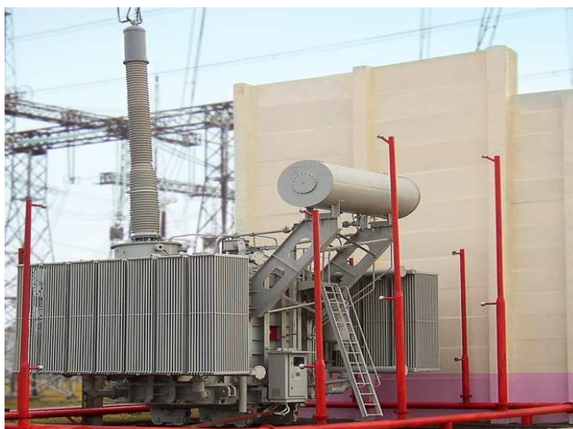
Рис. 1 – Однофазный шунтирующий реактор РОМ – 110000/750

и циркулирующих токов), составляют полные потери в обмотке. Снижение активных потерь возможно за счет конструктивного увеличения площади сечения обмоточного провода, а соответственно массы, габаритных размеров и, в конечном счете, стоимости реактора. С экономической точки зрения это нецелесообразно. Альтернативным вариантом снижения потерь в обмотке является минимизация добавочных потерь. Такой результат возможно реализовать за счет технического решения, заключающегося в изменении технологии наложения обмоточного провода. Исследования проводились на примере однофазного шунтирующего реактора мощностью 110000 кВАр и напряжением 750 кВ производства ПАТ "Запорожтрансформатор" (рис. 1) для двух вариантов обмоточного провода.