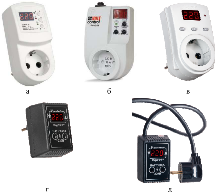
Рис. 2 – Примеры мобильных реле напряжения: а – ZUBR R116y [4] (ДС Электроникс, Украина); б – PH-101M [5] (Новатек-Электро, Россия); в – V-protector серии AS, г – V-protector 6A – 10A, д – V-protector 10Ash (Digitop, Украина) [6].

В однофазных стабилизаторах напряжения со встроенными реле защиты, как правило, такие реле являются частью электрической схемы стабилизатора и осуществляют защиту от недопустимых отклонений напряжения самого стабилизатора. Пороги срабатывания встроенной релейной защиты по напряжению в таких приборах и задержки автоматического повторного включения, как и в предыдущем случае, – фиксированные и устанавливаются производителем в зависимости от чувствительности к недопустимым отклонениям напряжения используемых в конструкции стабилизатора электронных компонентов. Как правило, пороги срабатывания по напряжению встроенной защиты стабилизаторов значительно шире граничных порогов, установленных в [9], чего требует назначение самого стабилизатора напряжения. Диапазон рабочих напряжений современных стабилизаторов от 100-130 В до 275 В.