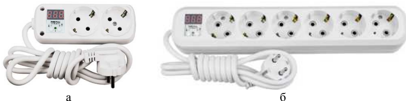
Рис. 3 – Примеры сетевых удлинителей со встроенным реле напряжения производства ДС Электроникс (Украина) [4]: а – ZUBR P216y, б – ZUBR R616y.

Сетевые удлинители со встроенными реле напряжения (рис. 3) осуществляют непосредственную защиту от недопустимых отклонений напряжения бытовых приборов, подключенных к такому удлинителю. Число розеток (гнезд) в таких удлинителях от 2 до 6. Такие удлинители выпускаются трехпроводными – с РЕ-проводником.