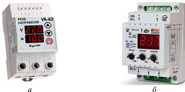
Рис. 4 – Реле напряжения: а – серия VA-protector с ограничителем мощности [11] (Digitor, Украина), б – PH-113 многофункциональное [12] (Новатек-Электро, Россия).

Примером такого решения могут служить реле серии VA-protector – рис. 4, а. В таком реле порог срабатывания по току выполняется регулируемым, время срабатывания токовой защиты фиксированное – 0,04 с. При необходимости функция защиты по току может быть отключена.