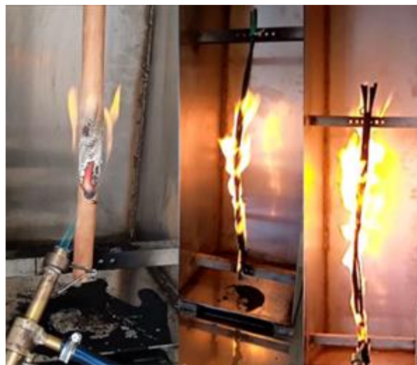
Рис. 2. Приклад випробування на вертикальне поширення полум'я одиночного кабелю (IEC/EN 60332-1-2).

звичайних кабелів управління, аби виграти час для захисту важливих систем під час надзвичайних ситуацій.